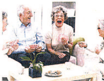
Freude an Gemeinsamkeit.

Die meisten Menschen möchten auch im Alter oder bei Pflegebedürftigkeit ihre eigenen vier Wände, in denen sie sich wohlfühlen, nicht aufgeben. Das bringt jedoch nicht selten Unsicherheit und auch Einsamkeit mit sich. Verständlicherweise ist für