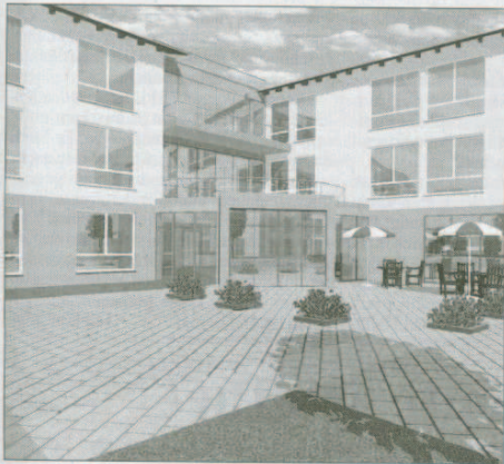
Der Eingangsbereich des Pflegezentrums.

Laut Bethke arbeiten über 500 Mitarbeiter in der Unternehmensgruppe. Zum ersten Spatenstich waren rund 60 geladene Gäste in Pohlheim erschienen.